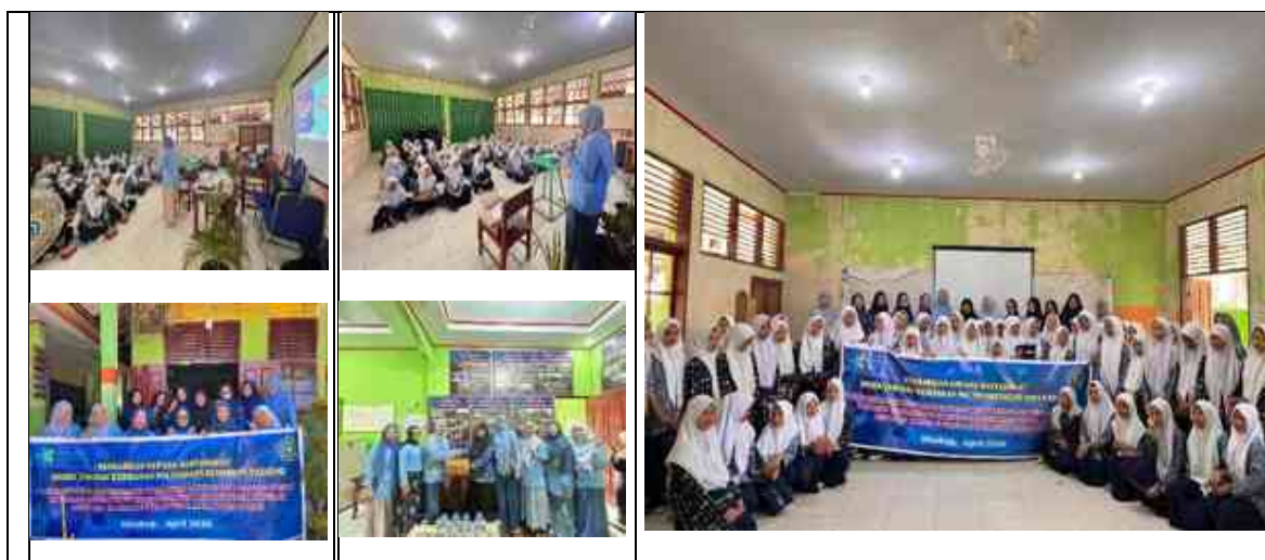
Gambar 3. Dokumentasi kegiatan pengabdian masyarakat

Berbagai metode dan media dapat digunakan untuk memberikan informasi dalam rangka meningkatkan pengetahuan dan keterampilan. Presentasi melalui power point, diskusi, dan tanya jawab digunakan dalam membekali diri remaja putri untuk mempersiapkan diri remaja putri pada saat bencana terjadi, sehingga ketika bencana terjadi remaja putri tau apa yang telah di siapkan, bagaimana dan kemana akan mencari pertolongan dan lain sebagainya. Mengingat tingginya risiko dan dampak bencana yang mungkin dapat terjadi di wilayah MTSN 2 Kepulauan Mentawai dan belum optimalnya upaya menciptakan kesiapsiagaan remaja putri selama ini, maka presentasi, diskusi dan tanya jawab di harapkan dapat menjadi salah satu solusi.