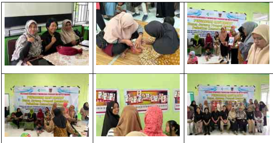
Gambar 2. Pelatihan Kader dan Edukasi Stunting, PMBA, dan Permainan Emo Demo Pada Kader Posyandu, Ibu Baduta dan Ibu Hamil.

Peningkatan pengetahuan kader posyandu terlihat dari hasil evaluasi pre-test dan post-test yang menunjukkan kenaikan nilai rata-rata dari 49,41 menjadi 77,51. Hasil ini mengindikasikan bahwa metode pelatihan yang digunakan efektif dalam meningkatkan pemahaman kader terkait stunting dan praktik PMBA. Peningkatan tersebut tidak terlepas dari penggunaan metode pembelajaran partisipatif seperti diskusi dan simulasi yang mampu meningkatkan keterlibatan aktif peserta. Secara teoritis, pendekatan pembelajaran orang dewasa (andragogi) menekankan pentingnya pengalaman langsung dan interaksi dalam proses belajar, sehingga materi yang diberikan lebih mudah dipahami dan diingat (Emiyanti et al., 2017). Hasil ini juga sejalan dengan berbagai penelitian yang menyatakan bahwa metode demonstrasi interaktif dapat meningkatkan pengetahuan kader secara signifikan dalam program kesehatan masyarakat.