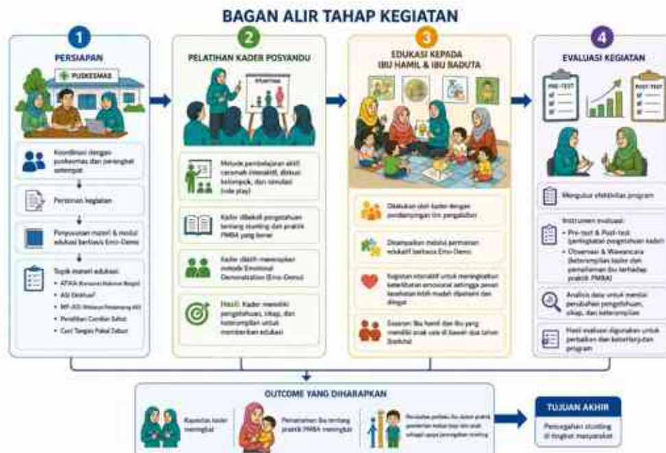
Gambar 1 Bagan Alir kegiatan PKM

Tahap keempat adalah evaluasi kegiatan yang dilakukan untuk mengukur efektivitas program. Evaluasi dilakukan menggunakan instrumen pre-test dan post-test untuk menilai peningkatan pengetahuan kader, serta observasi dan wawancara untuk menilai keterampilan kader dan pemahaman ibu sasaran terhadap praktik PMBA. Melalui tahapan tersebut, diharapkan terjadi peningkatan kapasitas kader serta perubahan pemahaman dan perilaku ibu dalam praktik pemberian makan bayi dan anak sebagai upaya pencegahan stunting di tingkat masyarakat.